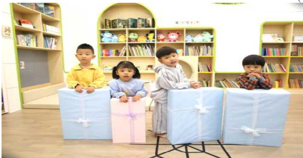
임직원의 가족친화와 일·가정 양립을 위한 ‘코코어린이집’을 함께 설립했다.

한국콘텐츠진흥원과 한국문화예술위원회가 임직원의 가족친화와 일·가정 양립을 위한 직장어린이집 ‘코코어린이집’을 함께 설립했다.