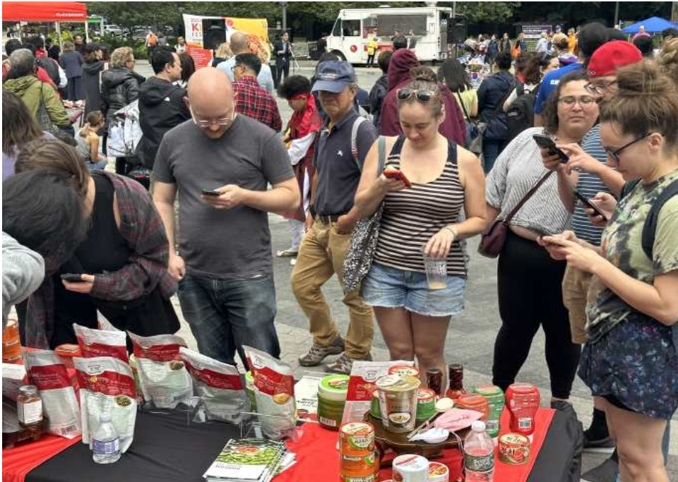
제4회 ‘김치의 날’을 맞아 현지 소비자를 대상으로 김치 소비 설문조사를 실시했다.

농림축산식품부와 한국농수산물유통공사(aT)는 11월 22일 제4회 '김치의 날'을 맞아 제2위 김치 수출국인 미국의 효율적인 마케팅을 통한 김치 소비 확대를 위해 현지 소비자 558명(비한국계 369명, 한국계 189명)을 대상으로 진행한 김치 소비 설문조사 결과를 공개했습니다.