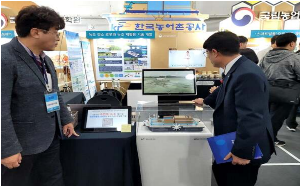
농어촌공사가 개발한 '녹조청소로봇'이 2023 과학기술대전 우수기술로 전시된다.

한국농어촌공사(사장 이병호)는 국립과천과학관에서 열리는 '2023 대한민국 과학기술대전(9~12일)'에 공사 부설 농어촌연구원이 개발한 '녹조청소로봇'(인공지능 무인 자율이동 조류포집장치)이 사회문제형 국가 R&D 우수기술로 전시된다고 9일 밝혔다.