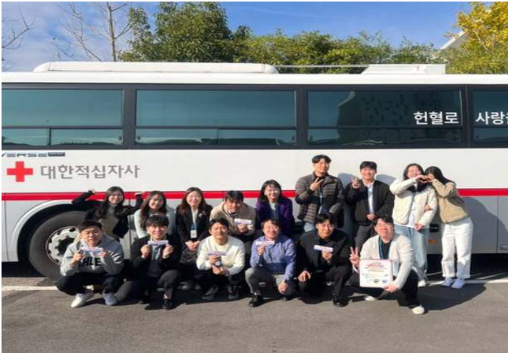
사학연금 임직원들이 헌혈 후 헌혈버스 앞에서 기념사진을 촬영하고 있다.

사립학교교직원연금공단(사학연금)은 지난 9일 추위로 인한 동절기 헌혈 감소상황에 대비하기 위해 대한적십자사 광주전남혈액원이 주관하는 헌혈캠페인에 참여했다고 밝혔다.