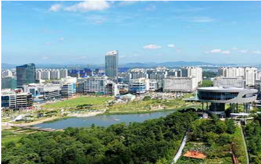
<빛가람 호수공원과 전망대>