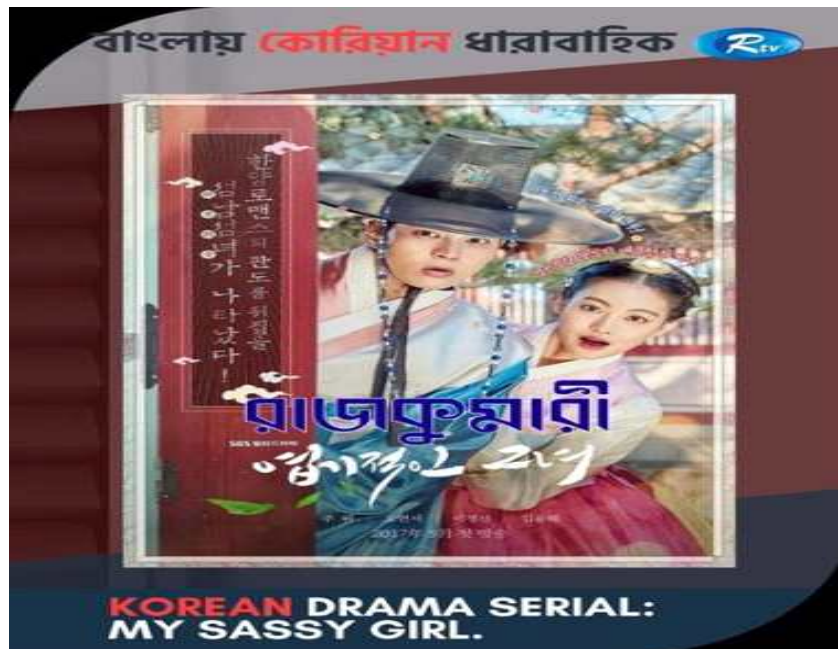
KCA가 K-콘텐츠 확산을 위해 방글라데시 방영권을 지원한다.

한국방송통신전파진흥원(KCA)이 국내 방송 콘텐츠의 방글라데시 방영을 지원한다. 이를 통해 K-콘텐츠와 한류 확산에 나선다는 계획이다.