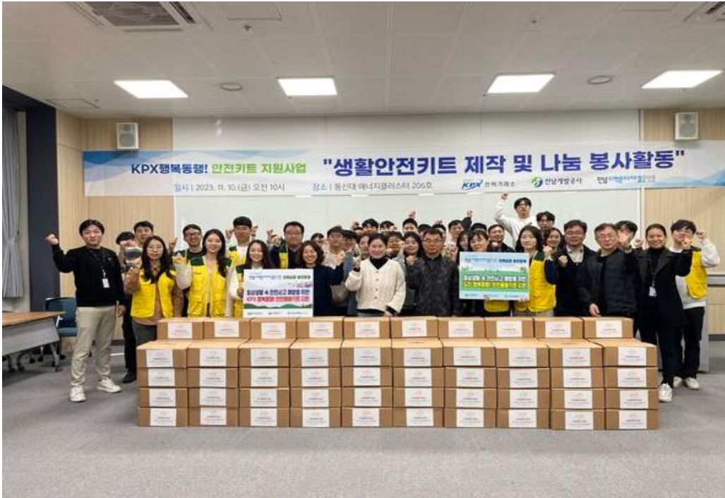
전력거래소는 지난 10일 나주·목포 지역 취약계층 130가구에 안전키트 제작 전달

한국전력거래소가 전남개발공사 임직원들과 함께 11월 10일 전남 내 나주, 목포지역 취약계층 130가구에 안전키트를 제작해 전달하였다.